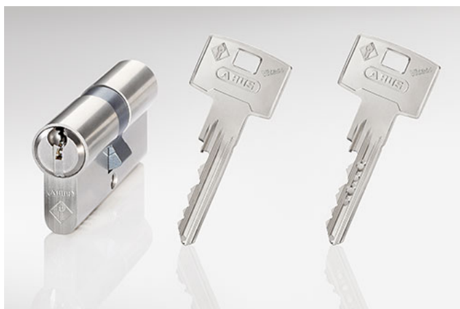
Abb. 2: Schließsystem Vitess

Vitess eignet sich neben dem Einsatz in Sperrschließungen dank seiner großen Profilvielfalt auch ideal für komplexe Schließanlagen sowohl in Werks- als auch in Eigenprofilen. Die Systemstufe Vitess.1000 lässt sich mit Vitess.2000 oder Vitess.4000 innerhalb einer Schließanlage kombinieren. Beispielsweise können die Eingangstüren eines Gebäudes mit Vitess.4000 und die Bürotüren mit Vitess.1000 gesichert werden. Damit profitieren die Nutzer der Schließanlage von dieser wirtschaftlich sinnvollen Lösung, die gleichzeitig die Sicherheitsanforderungen erfüllt.